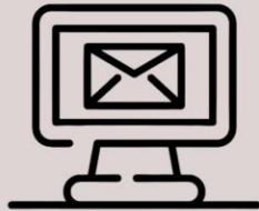
INSTRUCCIÓN A DISTANCIA

EL DEPARTAMENTO ALIENTA A LOS PADRES, EDUCADORES Y ADMINISTRADORES A COLABORAR CREATIVAMENTE PARA CONTINUAR CUMPLIENDO CON LAS NECESIDADES DE LOS ESTUDIANTES CON DISCAPACIDADES. CONSIDERE PRÁCTICAS COMO SER: