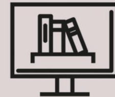
DOCUMENTACIÓN EN LÍNEA

ADEMÁS, EXISTEN ESTRATEGIAS DE BAJA TECNOLOGÍA QUE PUEDEN PROPORCIONAR UN INTERCAMBIO DE RECURSOS BASADOS EN EL PLAN DE ESTUDIOS, PAQUETES DE INSTRUCCIÓN, PROYECTOS Y TAREAS ESCRITAS.