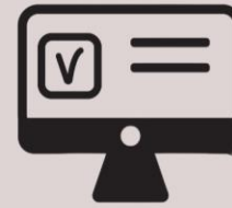
OPCIONES EN LÍNEA PARA CONTROL DE DATOS