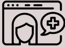
TELE TERAPIA Y TELE-INTERVENCIÓN